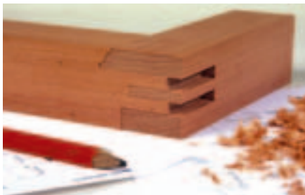
Assemblage traditionnel des ouvrants et des traverses intermédiaires à double enfouissement pour plus de solidité et une meilleure tenue