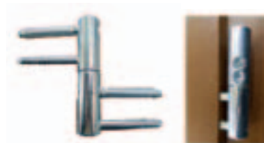
Fiche tridimensionnelle double broche : permet le réglage aisé sans dégonder l'ouvrant (translation, montée et compression) Permet d'optimiser l'isolation