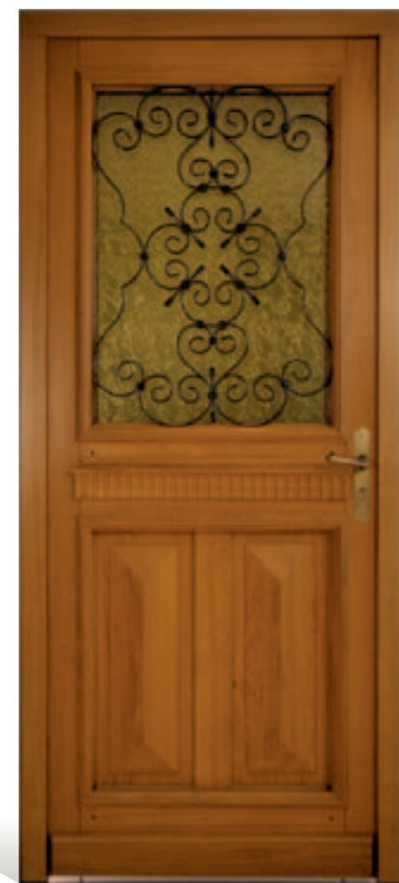
Laurie : panneaux pointes de diamant, cimaise crénelée en option : Chêne de France, vitrage "Antique" jaune et poignée Nevers laiton vieilli

Plus raffinée, plus ciselée, plus esthétique, cette nouvelle plinthe est désormais utilisée pour chacun de nos modèles à l'exception des portes de service.