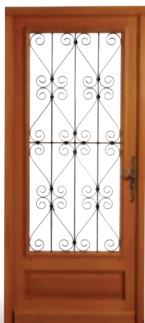
Sidonie avec châssis ouvrant