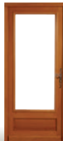
Salome avec châssis ouvrant