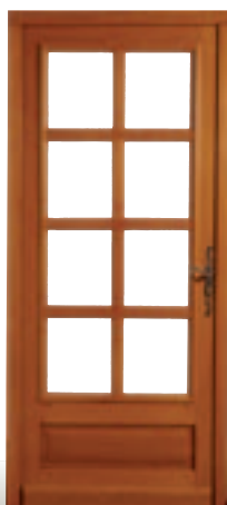
Sybille avec châssis ouvrant petits bois assemblés sur moulures grand cadres extérieures