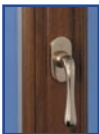
L'élégance du battement et de sa poignée centrée