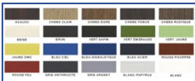
20 couleurs et tons bois