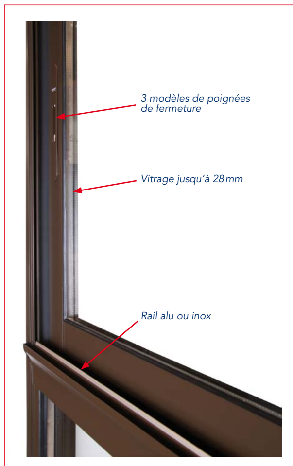
Côté intérieur: vue d'aluminium réduite (130 mm), suppression des empilages de menuiseries