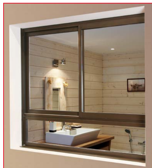
Bloc coulissant avec allège intégrée