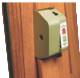
Pivot avec arrêt à 25° et blocage à 180° par bouton poussoir